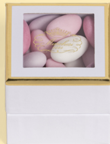
Cubo personalizzabile di confetti