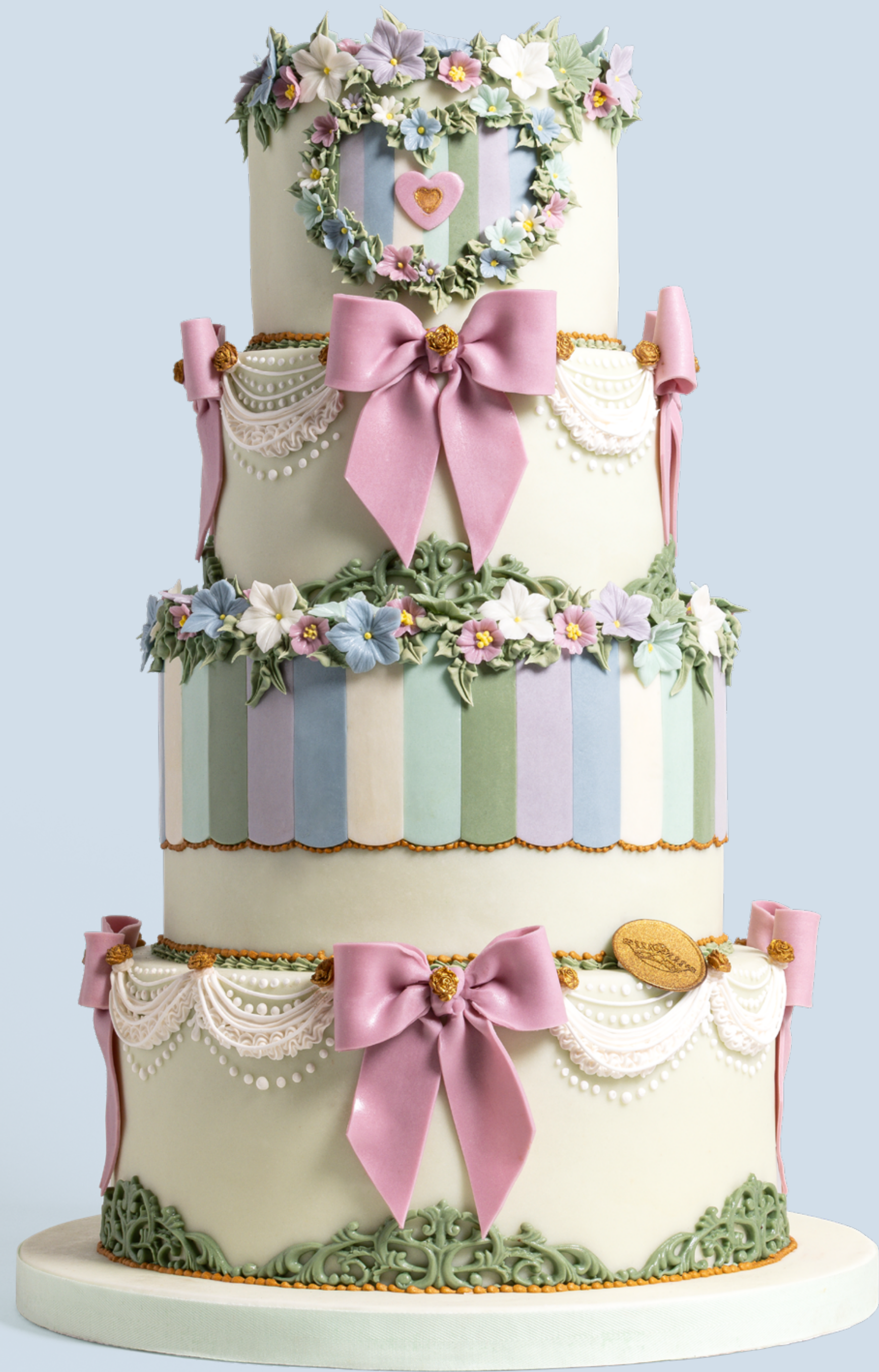
Colore: CLR010 Decorazione base: DCR030