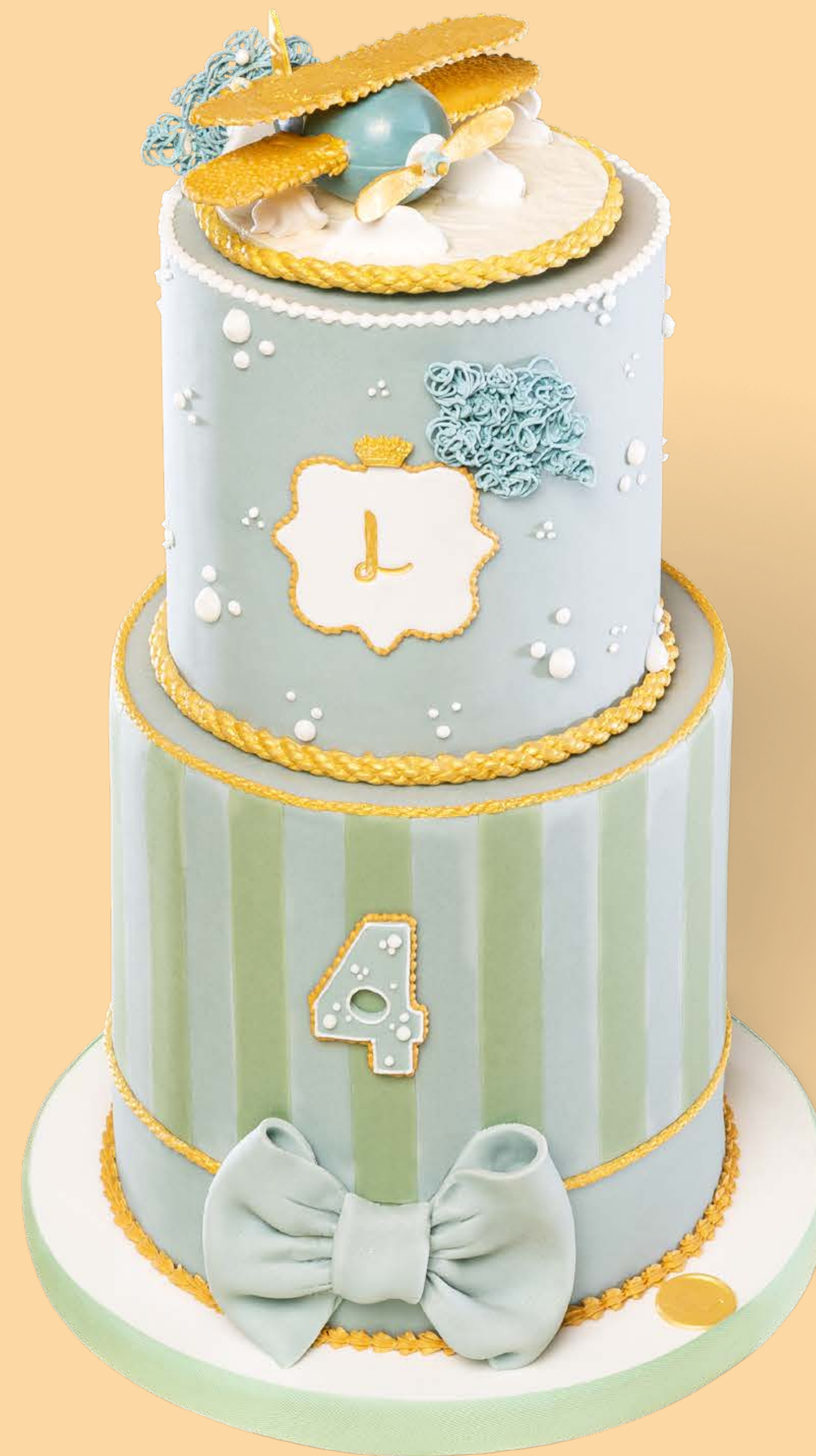
Colore: CLR007 + CLR008 Decorazione base: DCR009