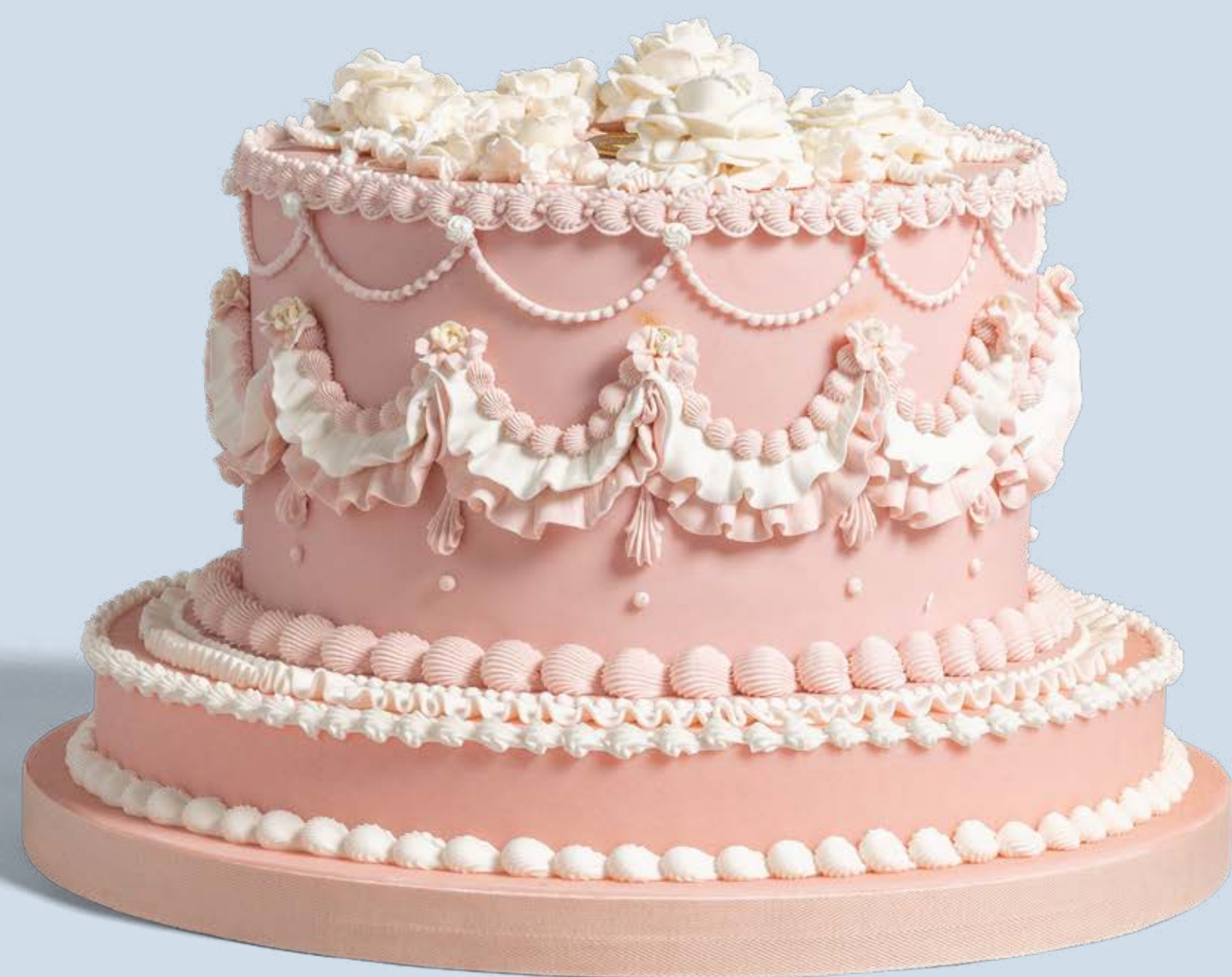
Colore: CLR004 Decorazione base: DCR0102