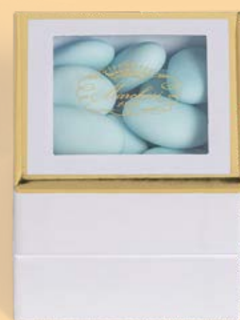
Cubo personalizzabile di confetti