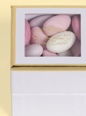
Cubo personalizzabile di confetti