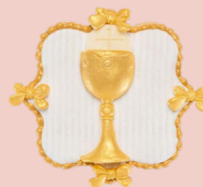
Biscotto decorato BSC008