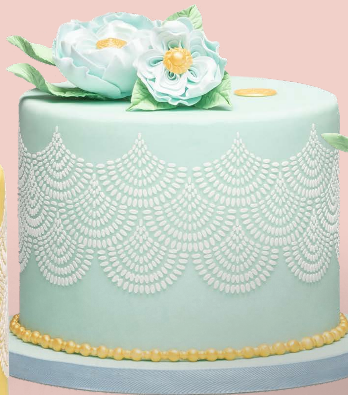
Colore: CLR002 Decorazione base: DCR001