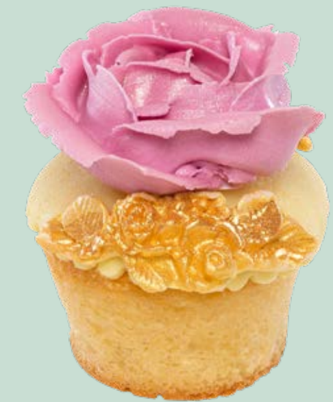
Muffin decorato MF002