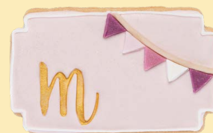
Biscotto decorato BSC017