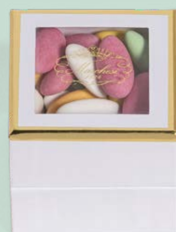
Cubo personalizzabile di confetti