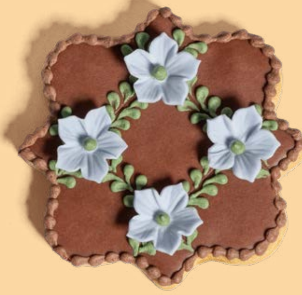
Biscotto decorato BSC101