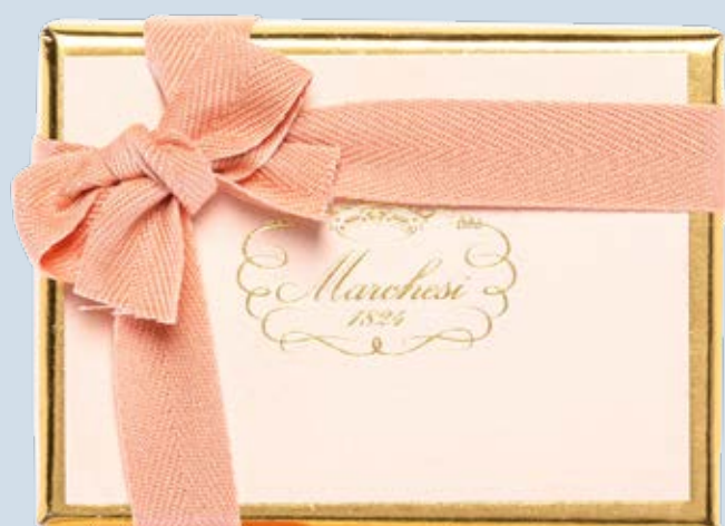
Box personalizzabile di gelatine, cremini e praline