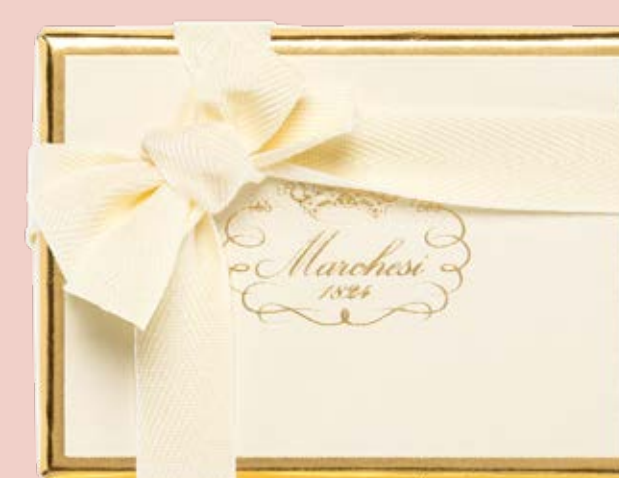
Box personalizzabile di gelatine, cremini e praline