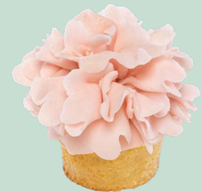
Muffin decorato MF005