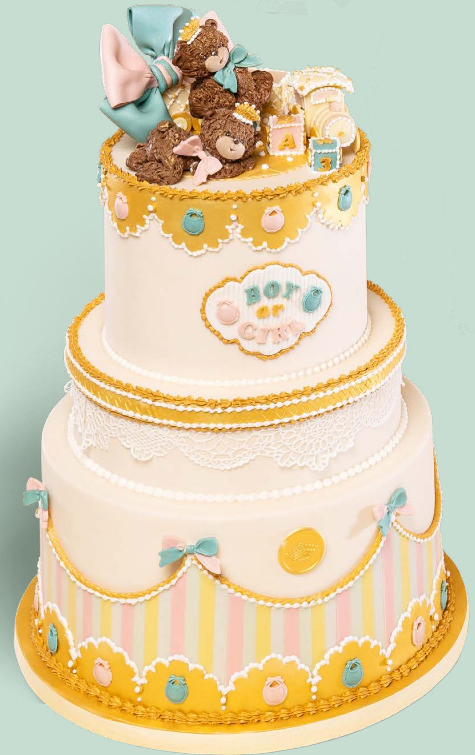
Colore: CLR006 Decorazione base: DCR006