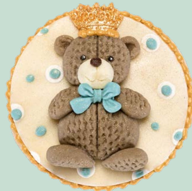
Biscotto decorato BSC010