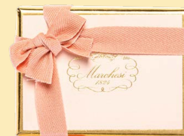
Box personalizzabile di gelatine, cremini e praline