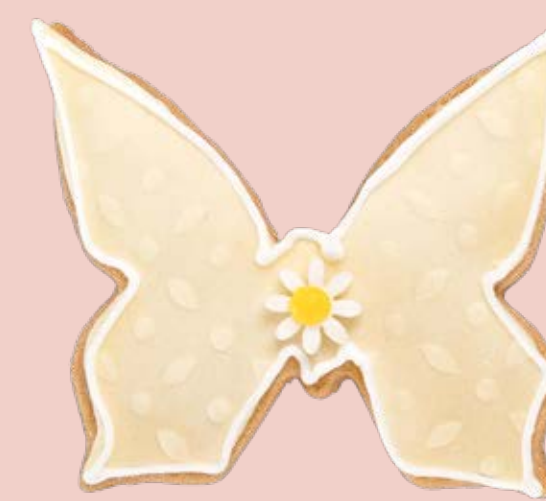
Biscotto decorato BSC020