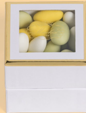
Cubo personalizzabile di confetti