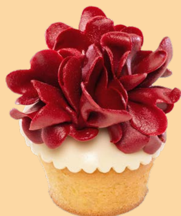
Muffin decorato MF006