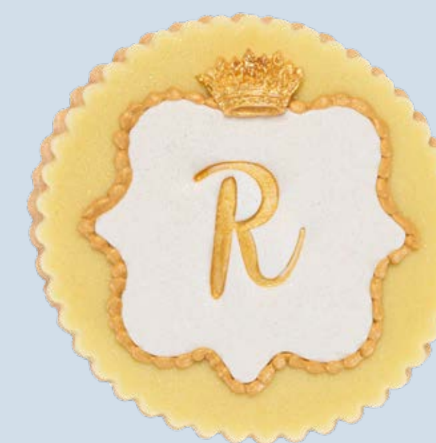
Biscotto decorato BSC024