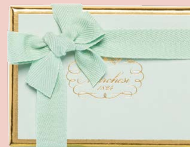
Box personalizzabile di gelatine, cremini e praline