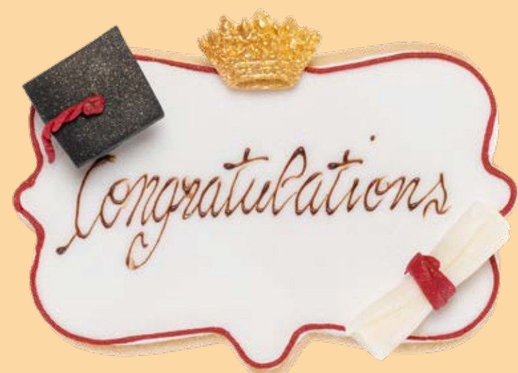
Biscotto decorato BSC006