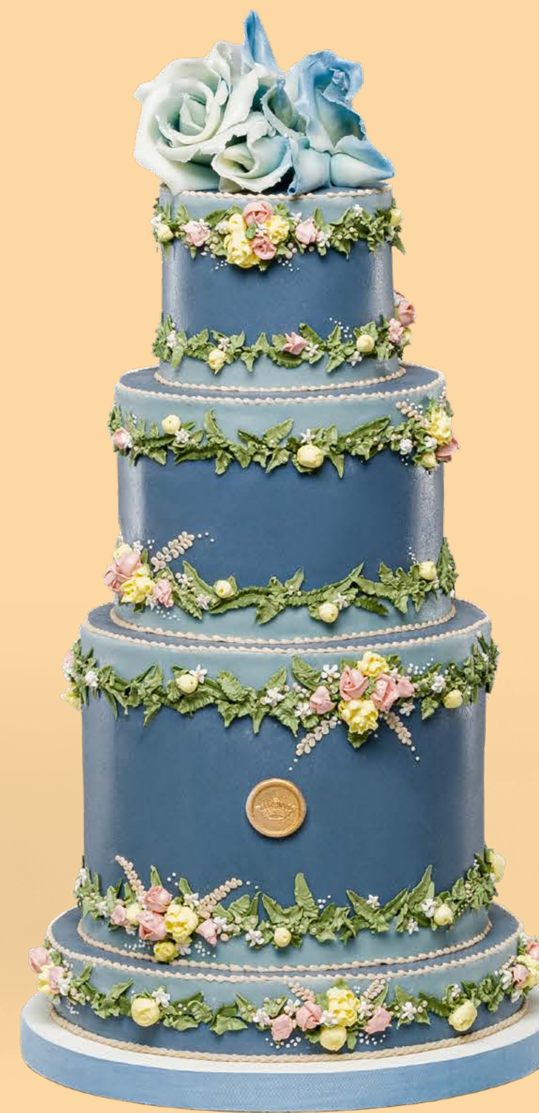
Colore: CLR009 Decorazione base: DCR017