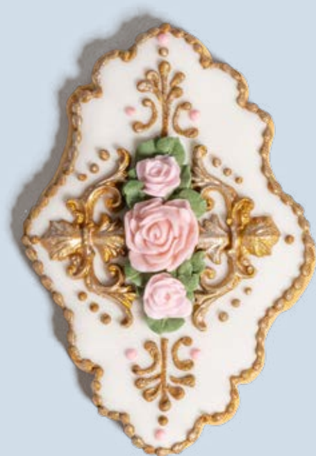
Biscotto decorato BSC100