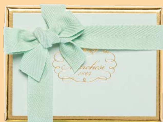
Box personalizzabile di gelatine, cremini e praline