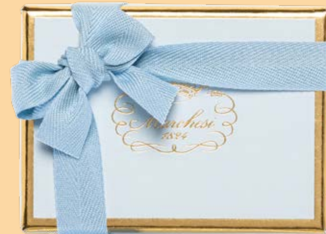
Box personalizzabile di gelatine, cremini e praline