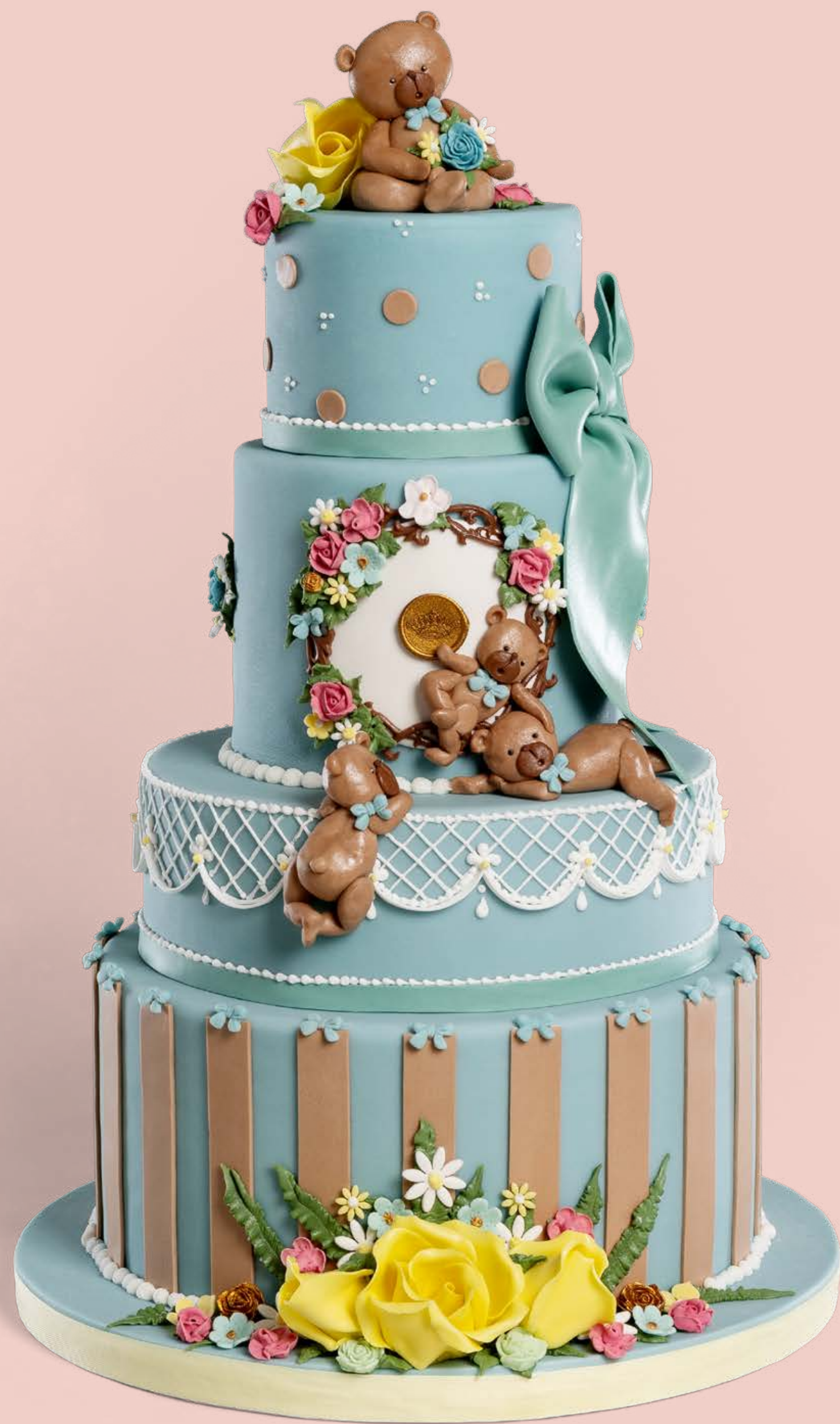
Colore: CLR002 Decorazione base: DCR026