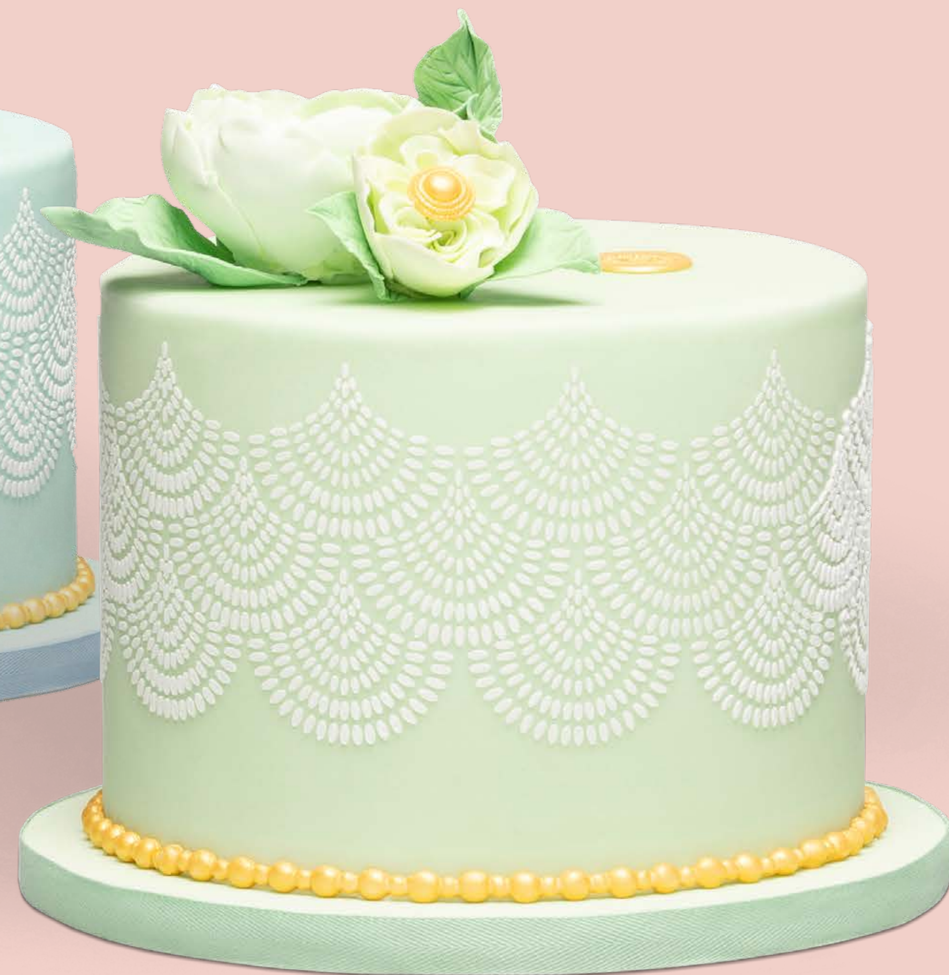
Colore: CLR003 Decorazione base: DCR001