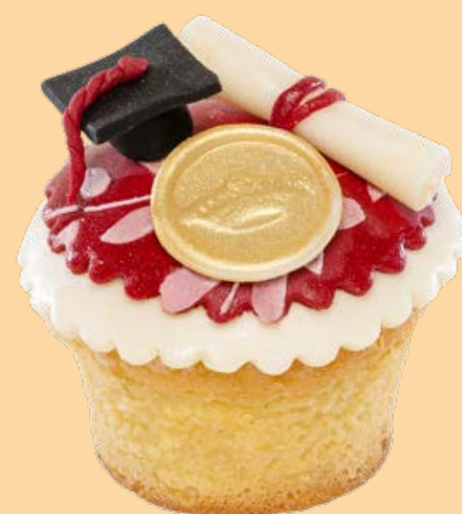
Muffin decorato MF007