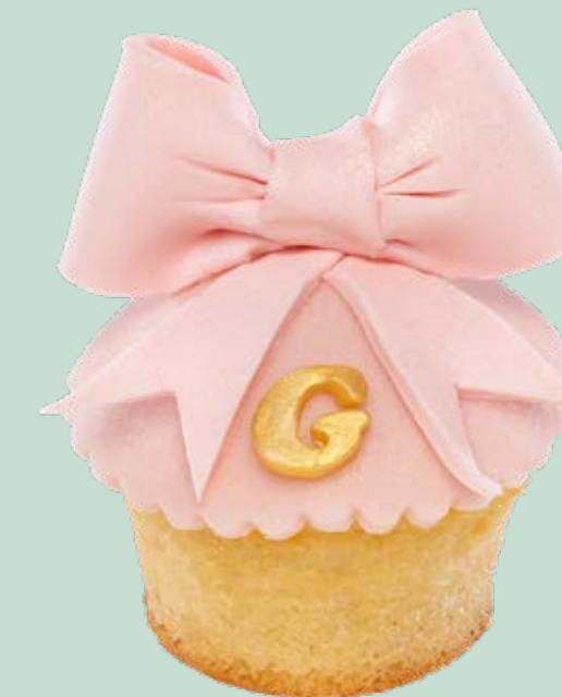
Muffin decorato MF004