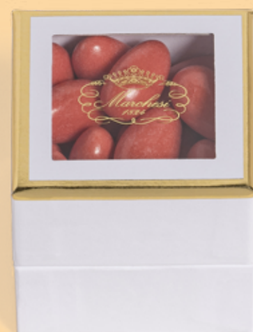
Cubo personalizzabile di confetti