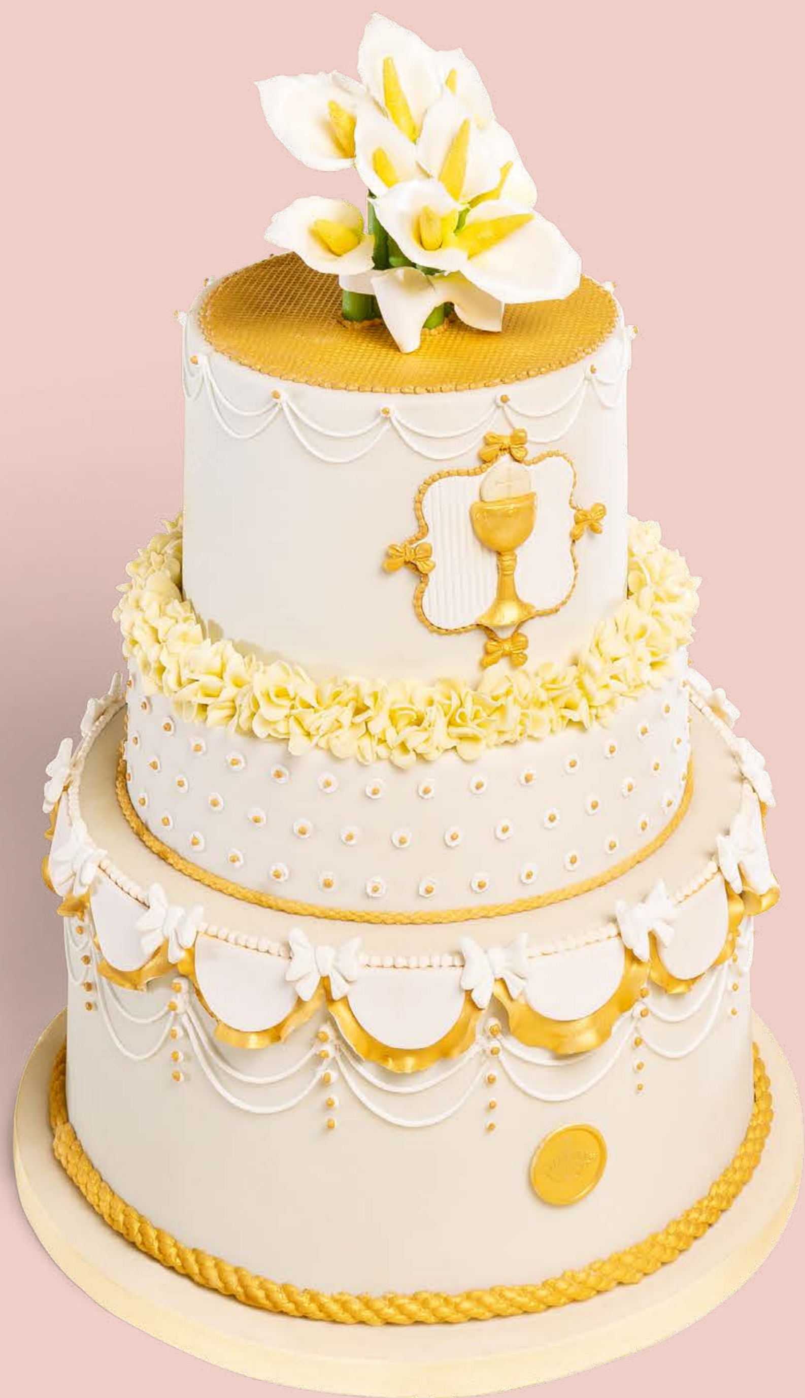
Colore: CLR005 Decorazione base: DCR005