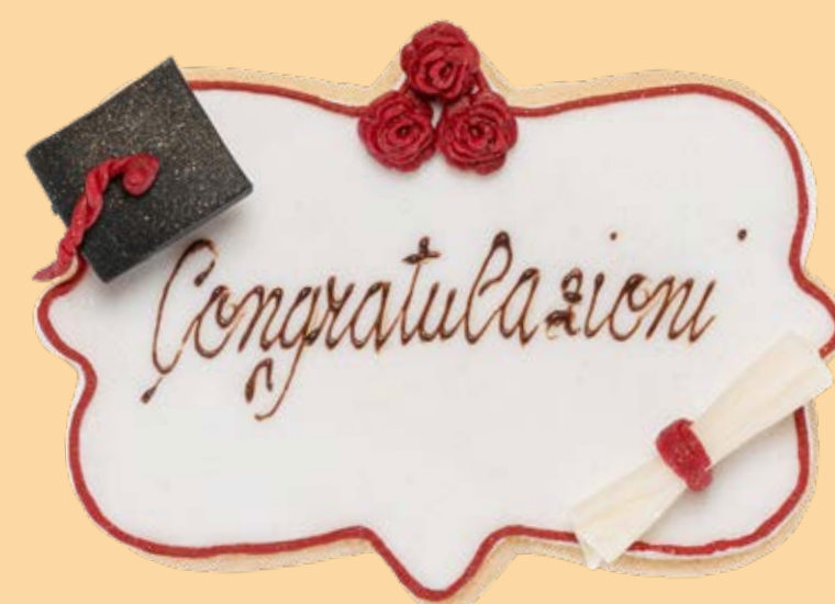
Biscotto decorato BSC007