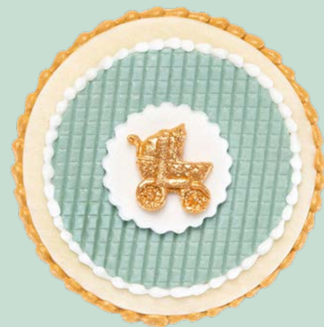
Biscotto decorato BSC012