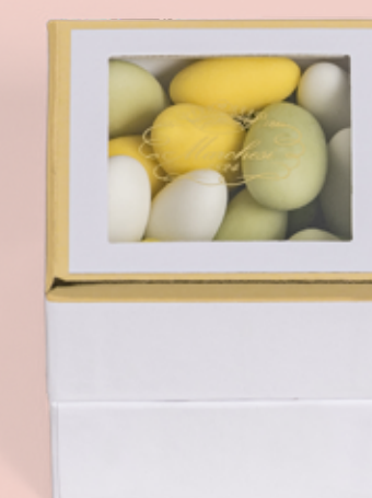
Cubo personalizzabile di confetti