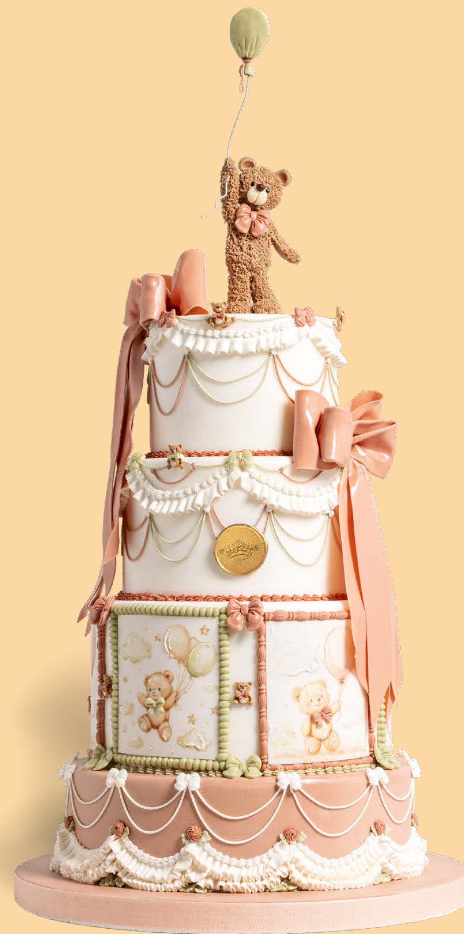
Colore: CLR004 + CLR006 Decorazione base: DCR033