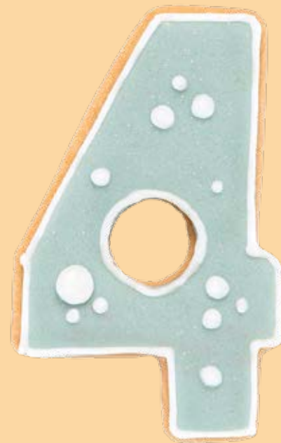
Biscotto decorato BSC021