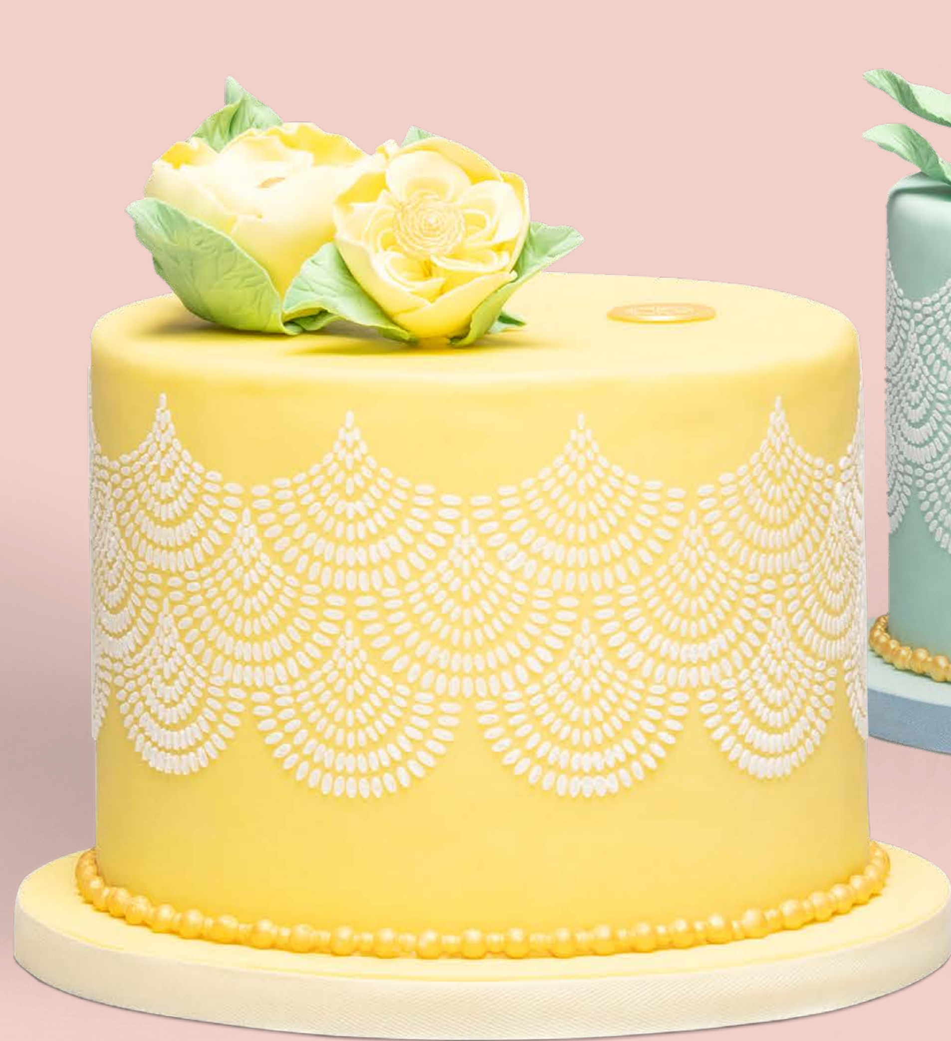
Colore: CLR001 Decorazione base: DCR001