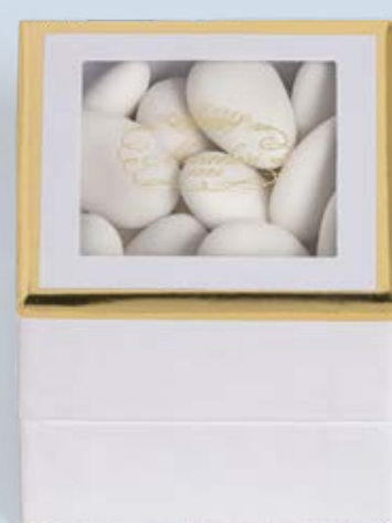
Cubo personalizzabile di confetti