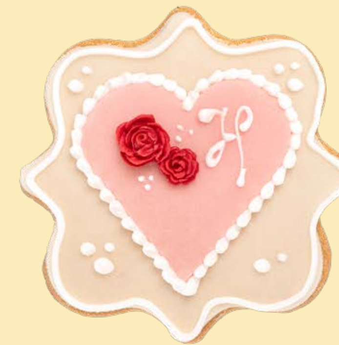
Biscotto decorato BSC032

Colore: CLR004 + CLR006 Decorazione base: DCR024