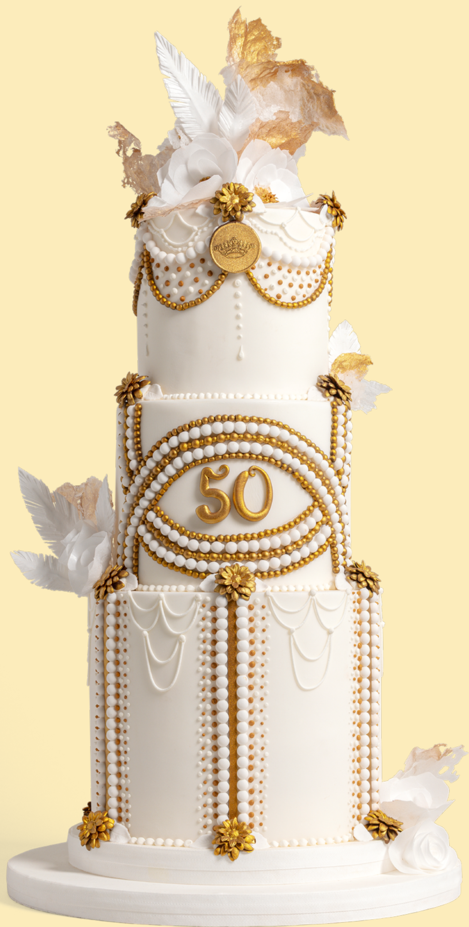
Colore: CLR006 Decorazione base: DCR032