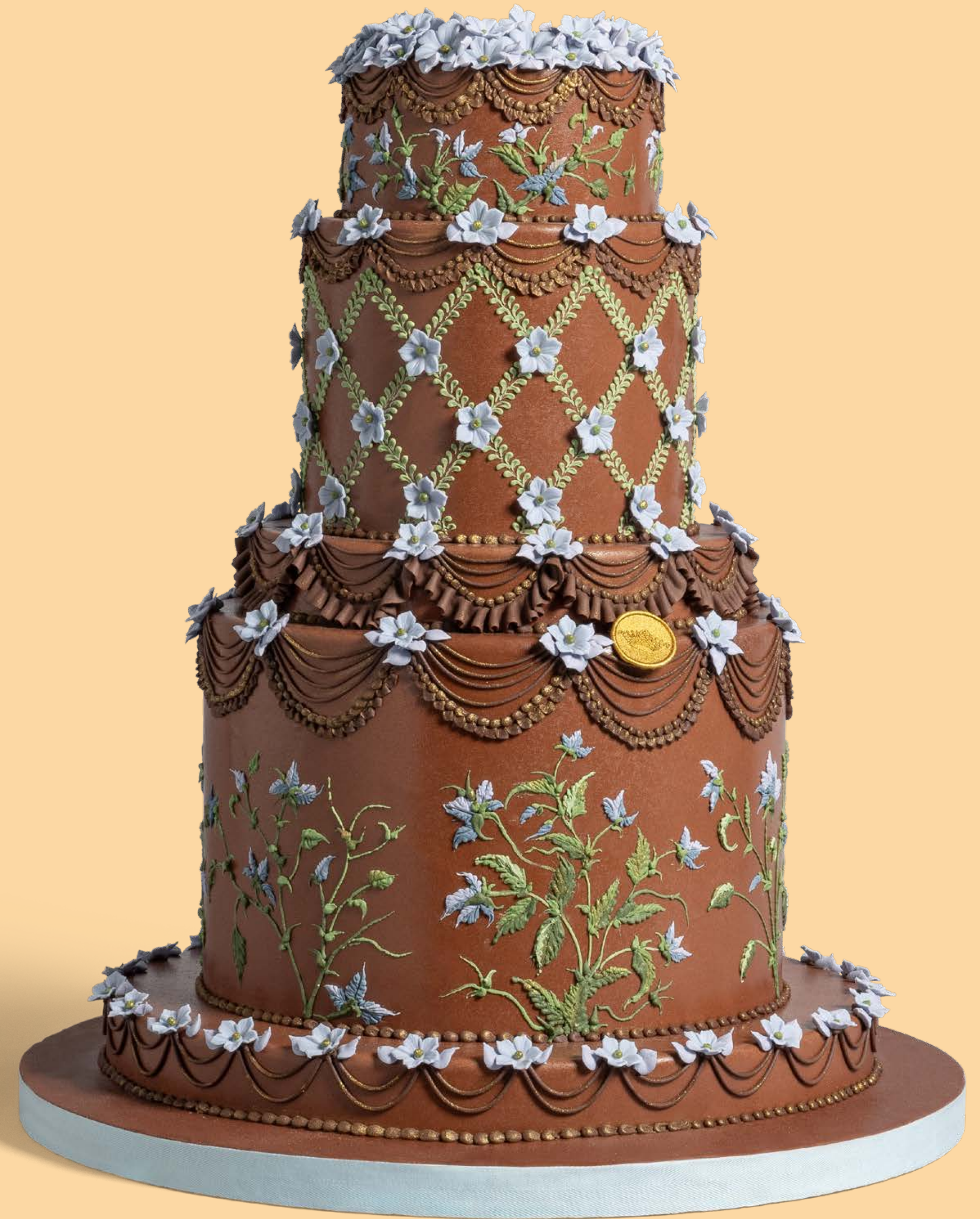
Colore: CLR021 Decorazione base: DCR0101