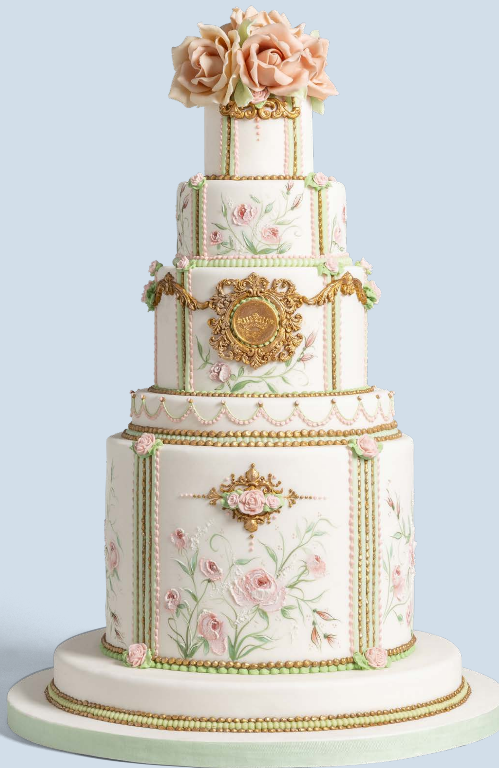
Colore: CLR006 Decorazione base: DCR0100