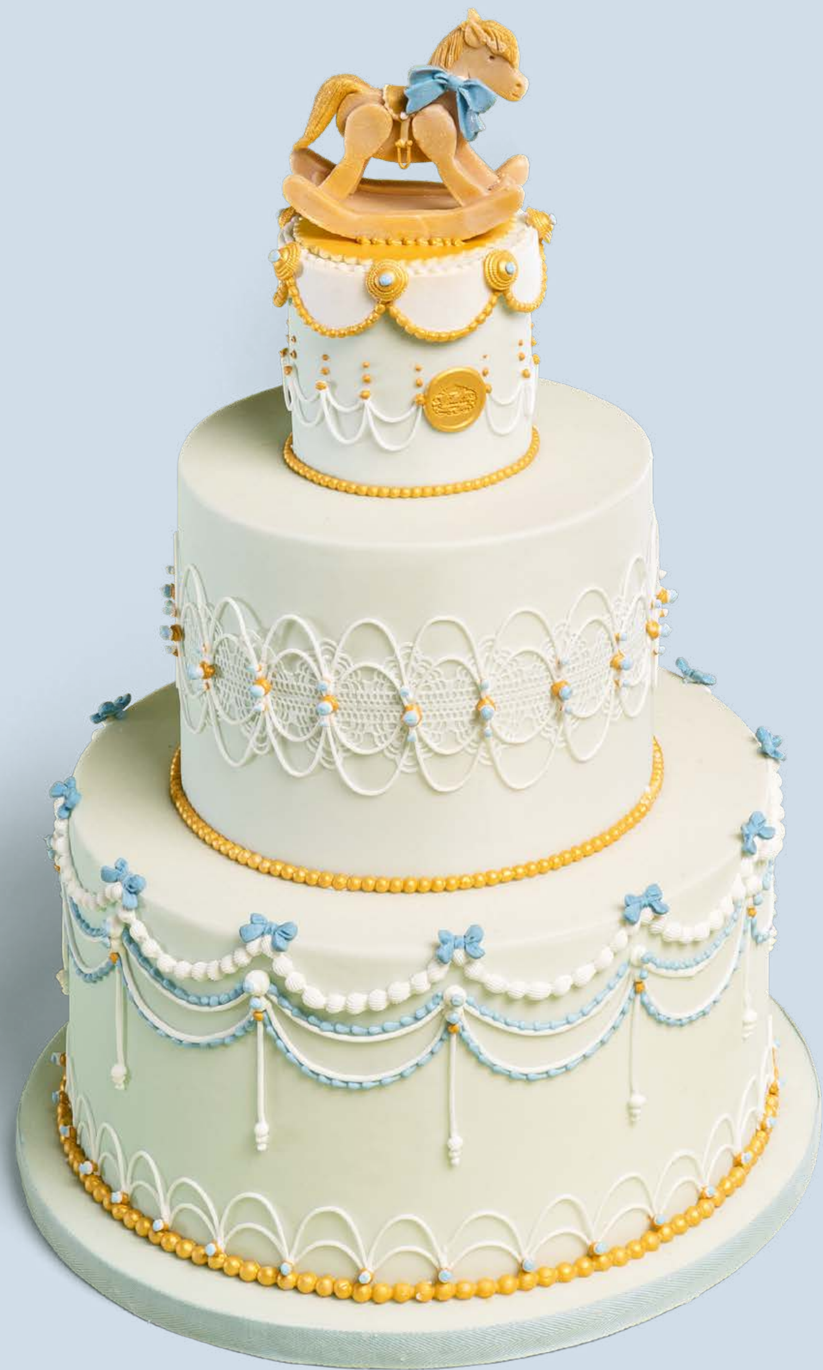
Colore: CLR002 Decorazione base: DCR010