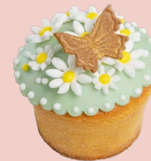
Muffin decorato MF020