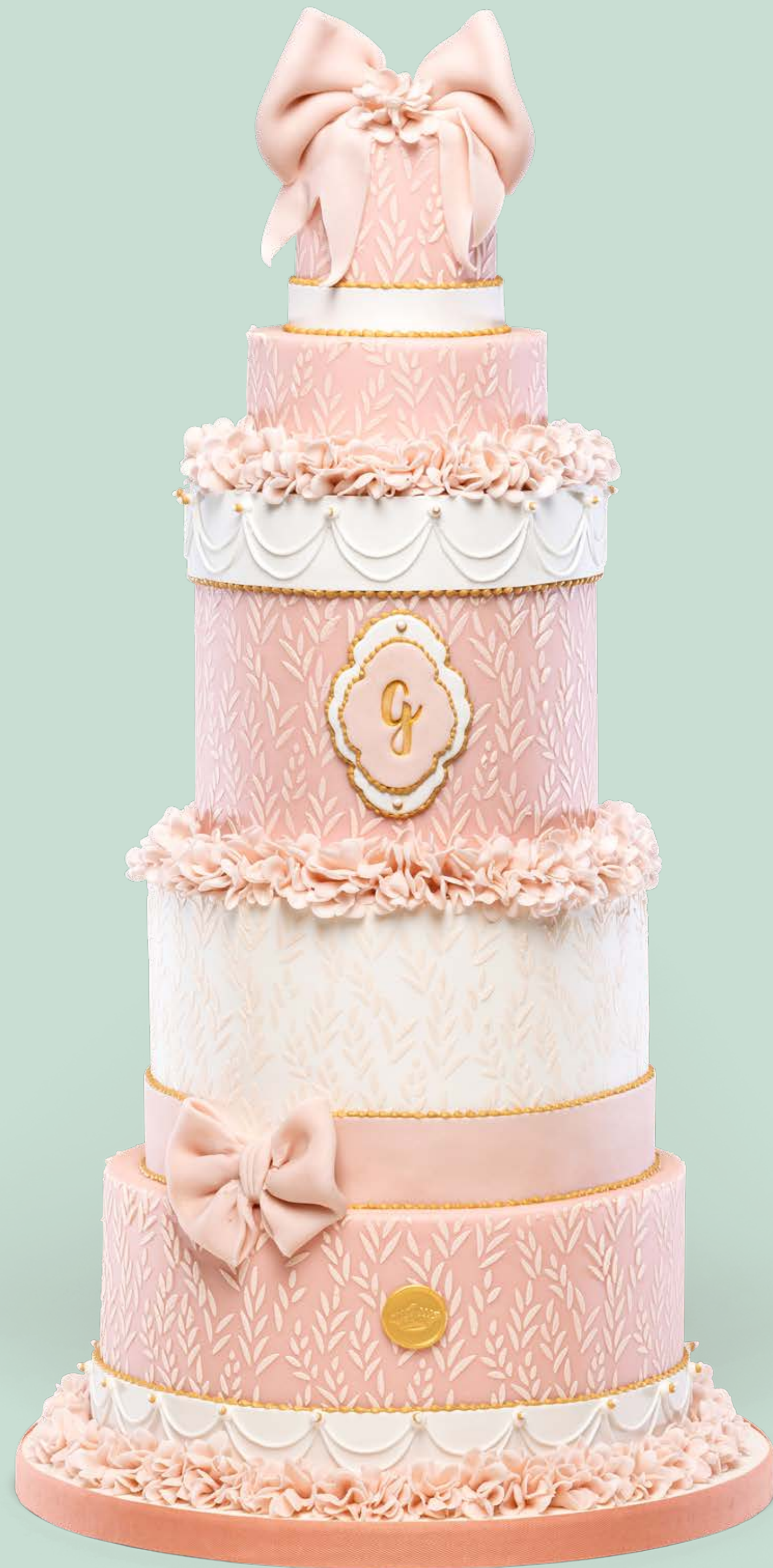
Colore: CLR004 + CLR006 Decorazione base: DCR002