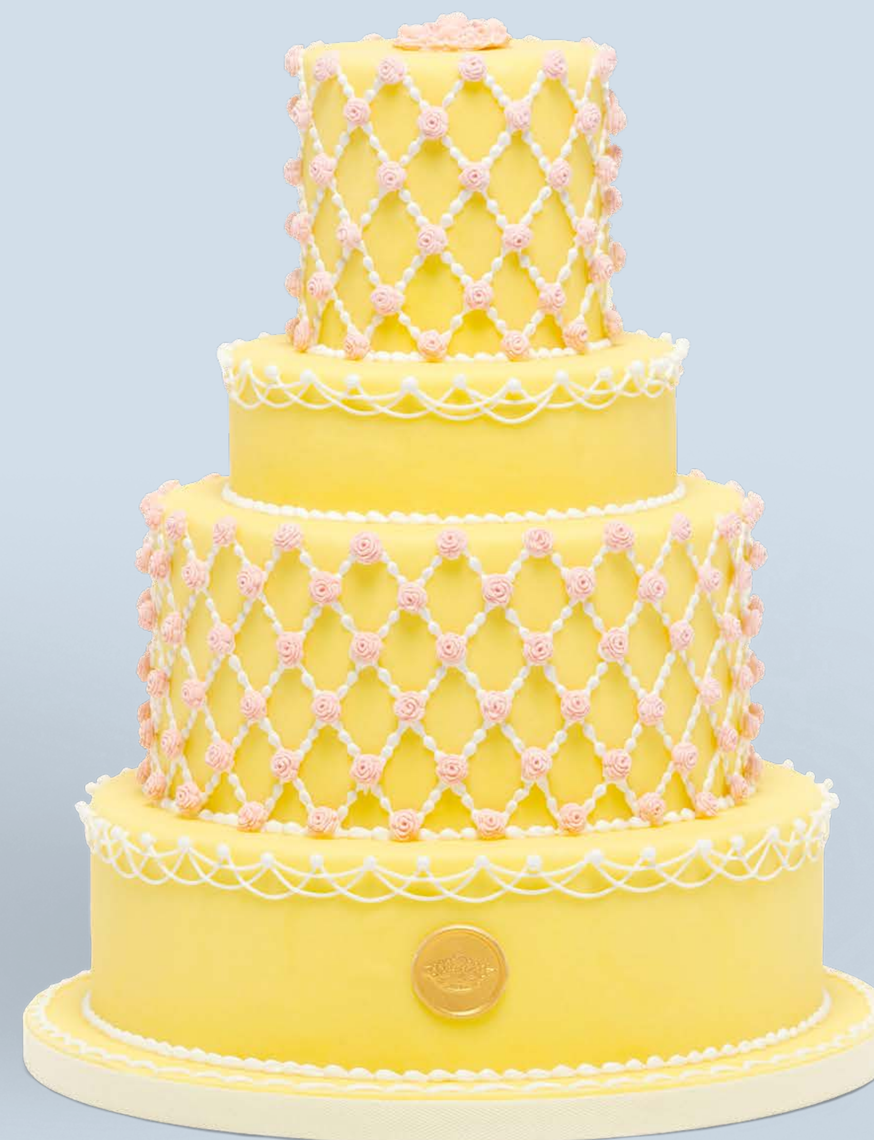
Colore: CLR001 Decorazione base: DCR015