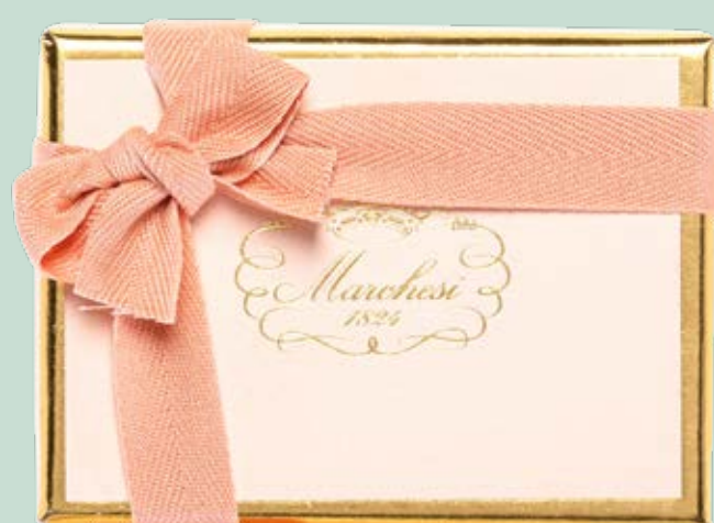
Box personalizzabile di gelatine, cremini e praline