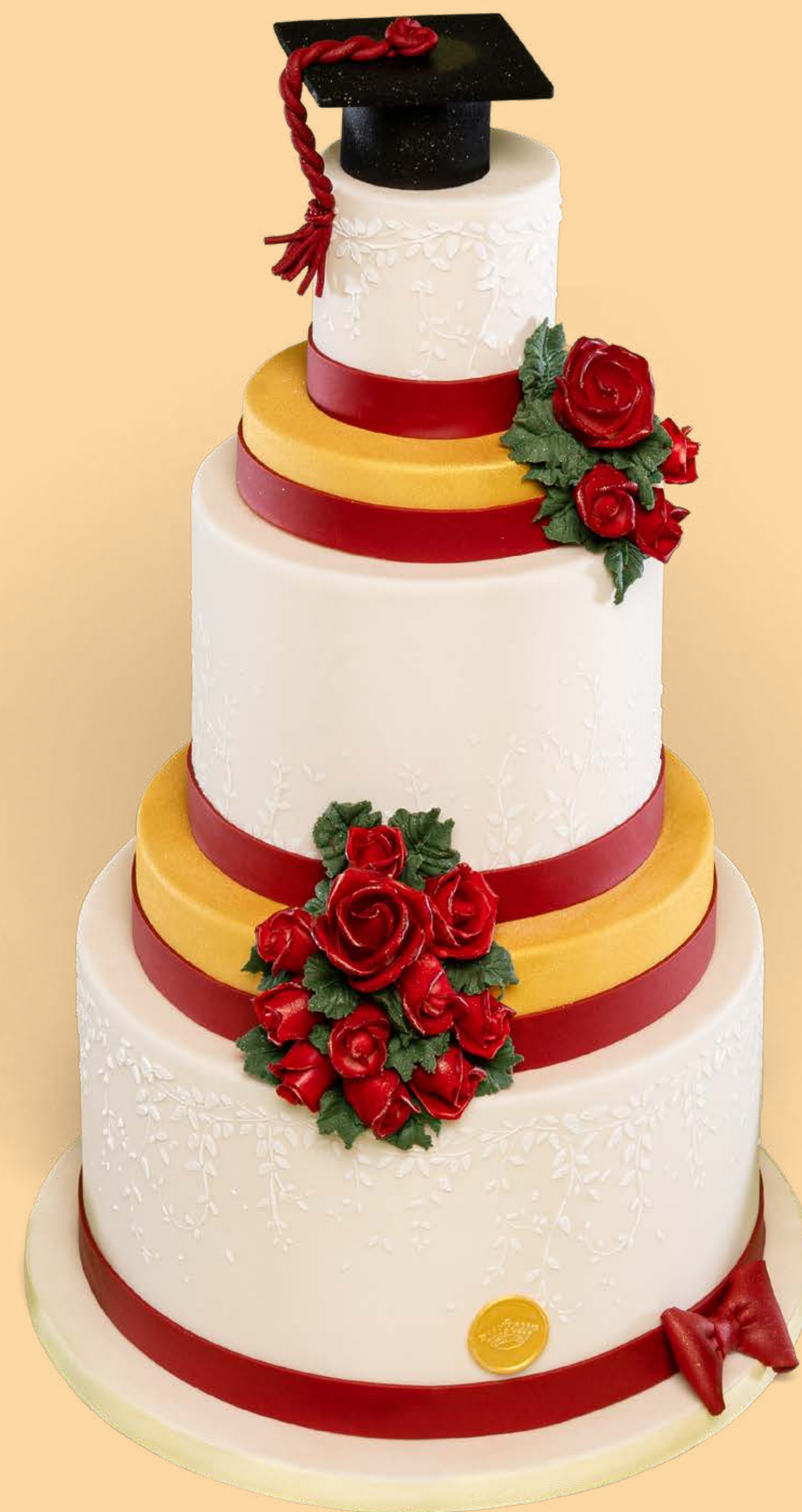
Colore: CLR005 Decorazione base: DCR004