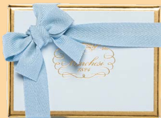
Box personalizzabile di gelatine, cremini e praline