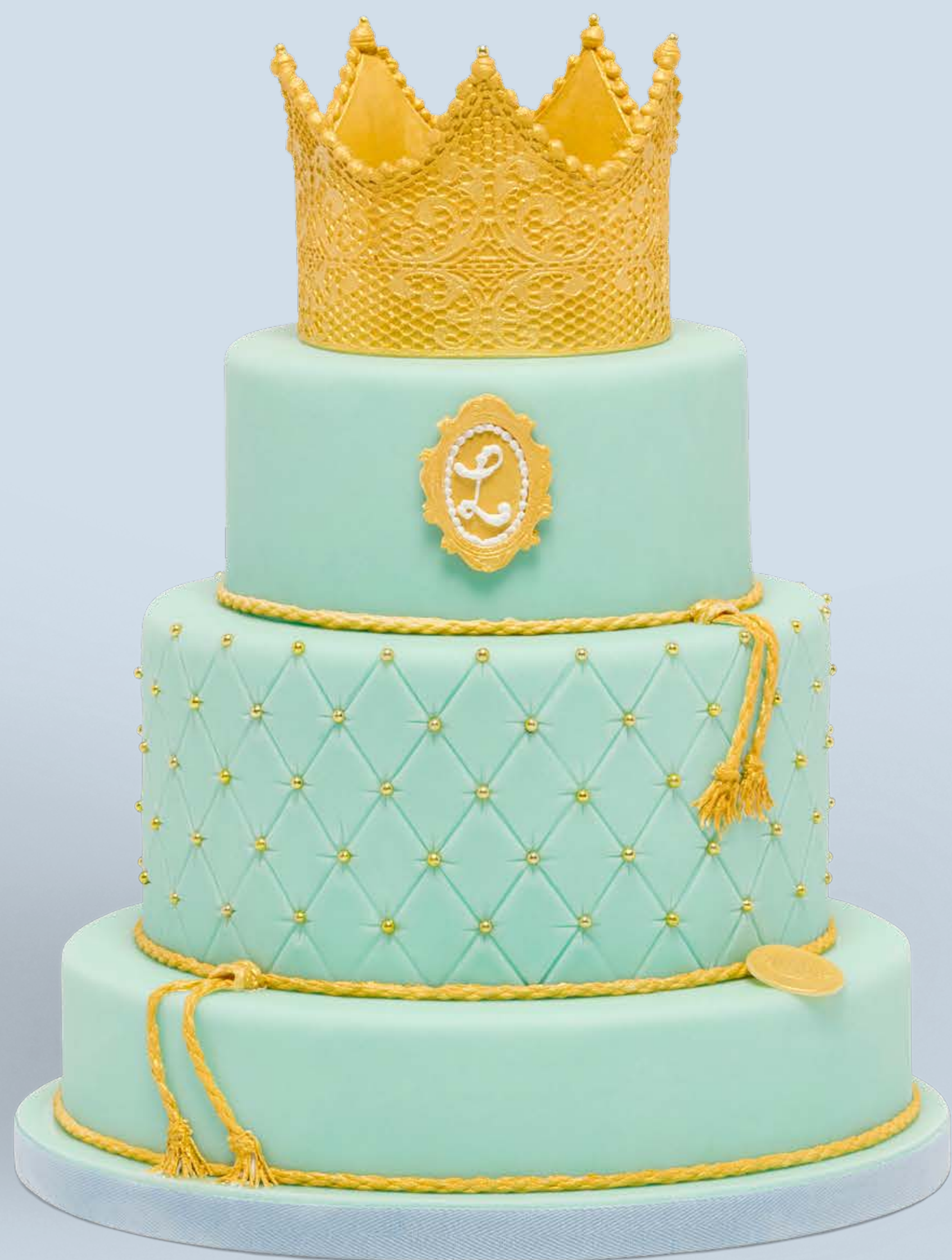
Colore: CLR002 Decorazione base: DCR013