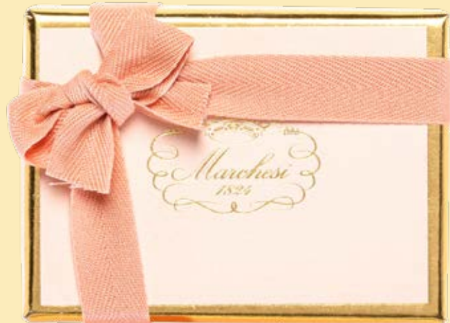
Box personalizzabile di gelatine, cremini e praline