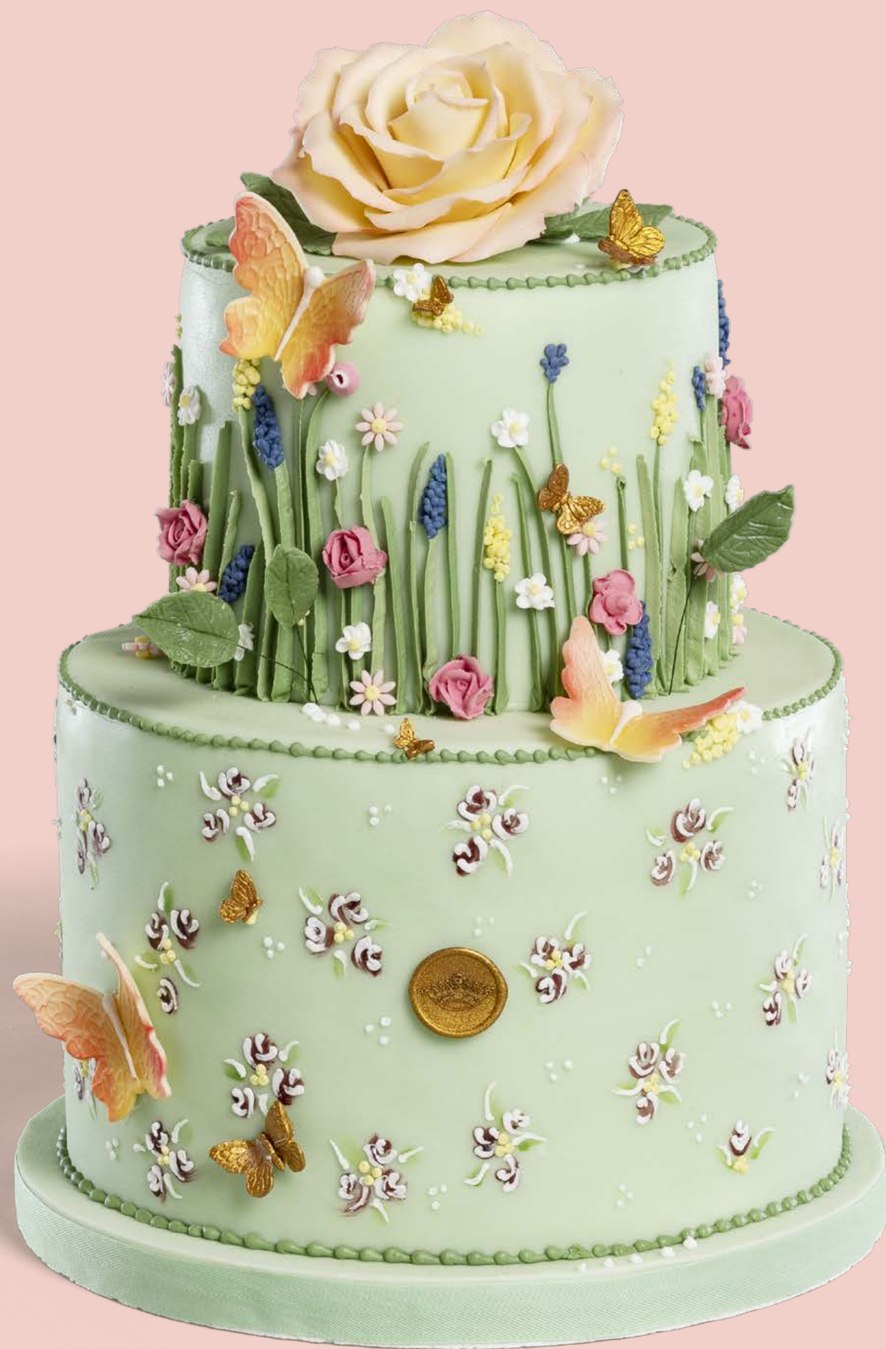
Colore: CLR003 Decorazione base: DCR020