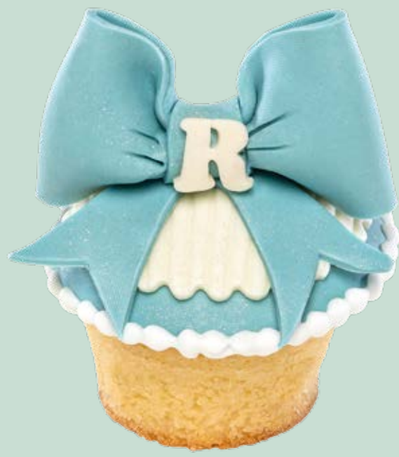
Muffin decorato MF009